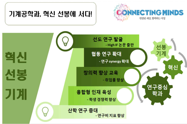
<그림 1> 기계공학과 혁신 선봉에 서다